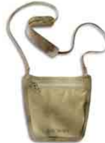
WP Neck Pouch/natural