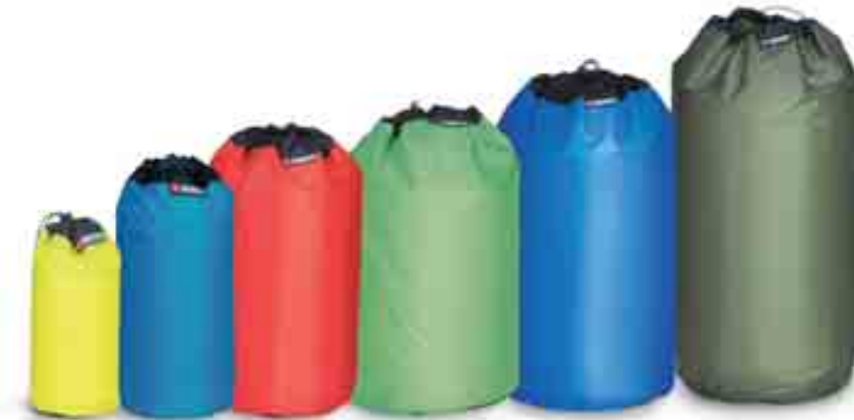
XXS = spring XS = bright blue S = red M = bamboo L = blue XL = cub

Artikel: 3059 Rundbeutel XXS Farben: 316 spring UVP: 6,00 €