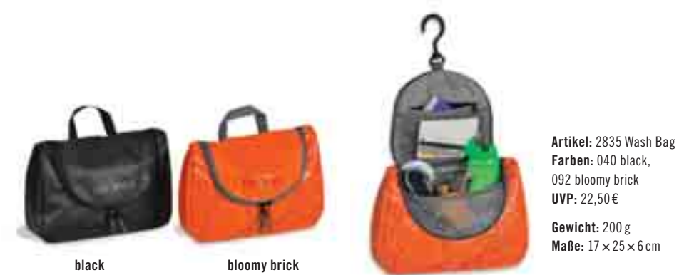
Artikel: 2835 Wash Bag Farben: 040 black, 092 bloomy brick UVP: 22,50 € Gewicht: 200 g Maße: 17 × 25 × 6 cm

Kulturbeutel aus wasserdichtem Tarpaulin. Der Wash Bag verfügt über einen bruchsicheren Spiegel, der auch Zusammenstöße mit anderem Kosmetiktascheninhalt gut verkraften kann. Mit Hilfe der Aufhängevorrichtung findet der Wash Bag an jedem Wandhaken einen sicheren Platz. In den Einsteckfächern und der großen Netztasche ist Platz für die benötigten Hygieneartikel, und für die Produkte zur schnellen Pflege zwischendurch gibt's an der Rückseite noch eine flache Einstecktasche.