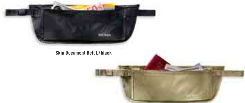
Skin Document Belt L/black