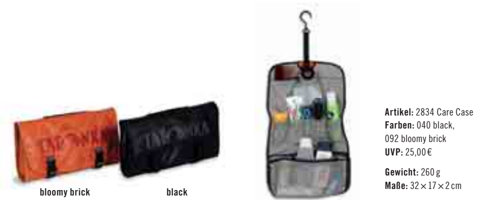
Artikel: 2834 Care Case Farben: 040 black, 092 bloomy brick UVP: 25,00 € Gewicht: 260 g Maße: 32 × 17 × 2 cm

Waschtasche aus Tarpaulin. Hier passt alles rein, was man braucht. Und das ist dank Tarpaulin auch noch vor Spritzwasser geschützt. Im Inneren verfügt das Care Case über diverse Einstecktaschen und eine richtig große Reißverschluss-Netztasche, das Hauptfach der Kulturtasche sozusagen. Funktionale Details wie Haargummihalter oder Aufhängevorrichtung runden das Care Case ab.