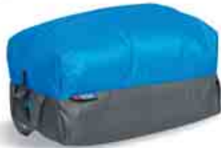
L = bright blue