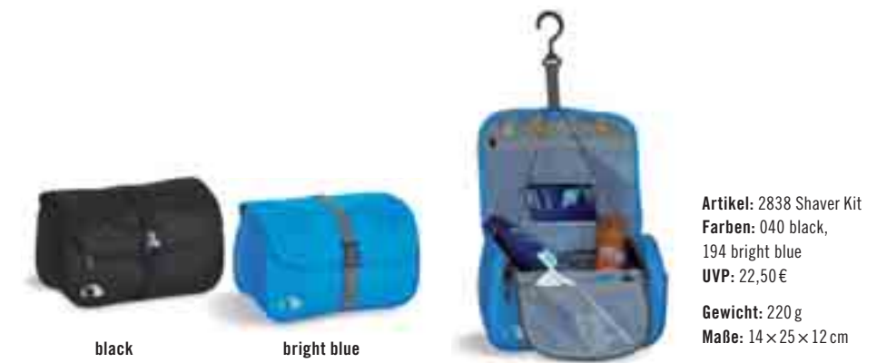
Artikel: 2838 Shaver Kit Farben: 040 black, 194 bright blue UVP: 22,50 € Gewicht: 220 g Maße: 14 × 25 × 12 cm

Kompakte Kultur- und Rasiertasche. Der ideale Begleiter für Männer auf Reisen: In der Kultur- und Rasiertasche finden alle Hygieneartikel des täglichen Bedarfs ihren Platz – inklusive Rasierzeug. Shaver Kit verfügt über eine durchdachte Inneneinteilung, einen drehbaren Haken zum Aufhängen und einen Handgriff, mit dem man ihn auch mal bequem über den Campingplatz und wieder zurück tragen kann.