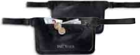
WP Document Belt/black