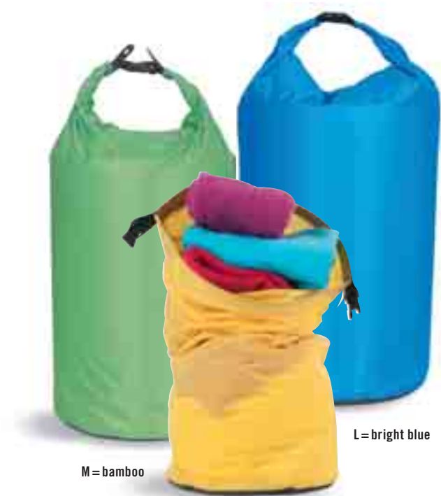
M = bamboo