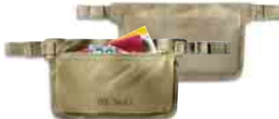
WP Document Belt/natural