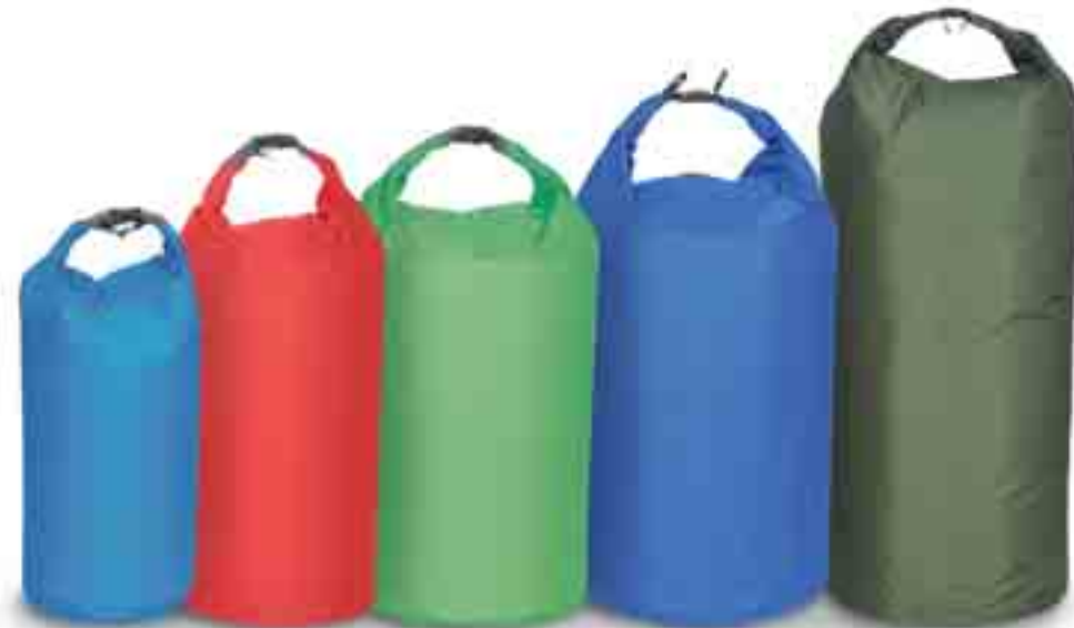
XS = bright blue