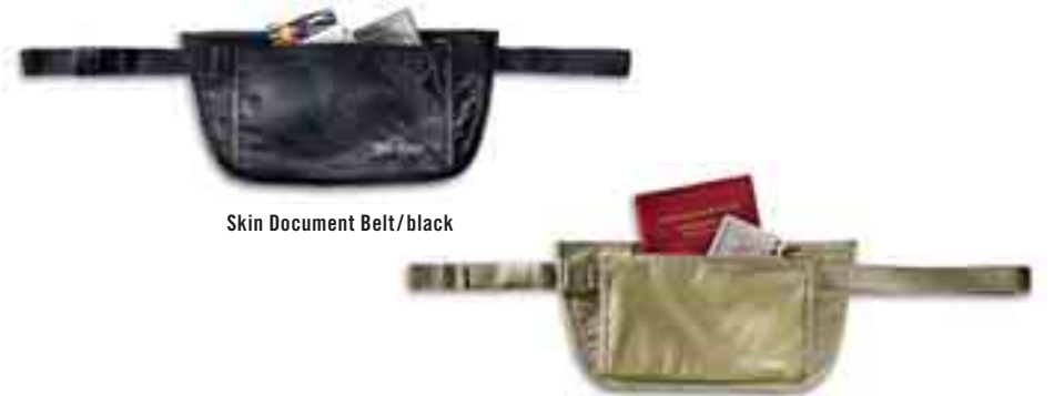
Skin Document Belt/black