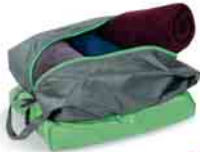
M = bamboo