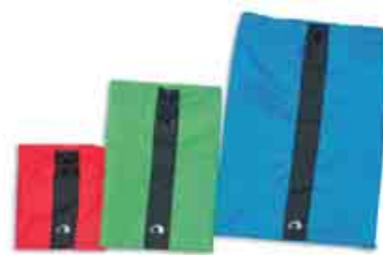
red bamboo bright blue

Artikel: 3038 Flachbeutel Set Farben: 001 assorted UVP: 12,00 €