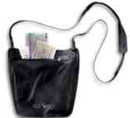
WP Neck Pouch/black

Artikel: 2905 WP Moneybelt Farben: 040 black, 225 natural UVP: 22,50 € Gewicht: 36 g Maße: 13 × 30 cm