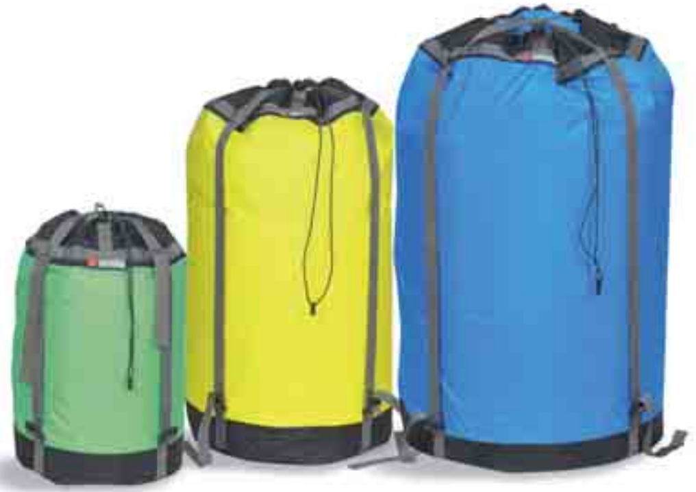
S = bamboo

Aufbewahrungstasche mit zwei Fächern. Da passt eine Menge rein, und in den zwei Fächern lässt sich zum Beispiel saubere und schmutzige Wäsche trennen. Mit Reißverschluss. Material: T-Rip Light