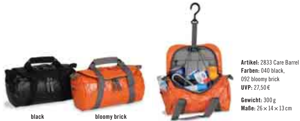
Artikel: 2833 Care Barrel Farben: 040 black, 092 bloomy brick UVP: 27,50 € Gewicht: 300 g Maße: 26 × 14 × 13 cm

Strapazierfähige Kulturtasche in attraktiver Optik. Wer dachte, der Barrel sei ausschließlich für Maximalgepäck zu gebrauchen, kann sich jetzt bei der Körperpflege vom Gegenteil überzeugen. Der Care Barrel ist eine perfekte Kombination: genauso robust wie das große Vorbild, aber mit einer durchdachten, modernen Kulturbeutel-Aufteilung. Funktionale Details wie ein drehbarer Aufhängehaken und der unzerbrechliche Spiegel machen den Care Barrel komplett.